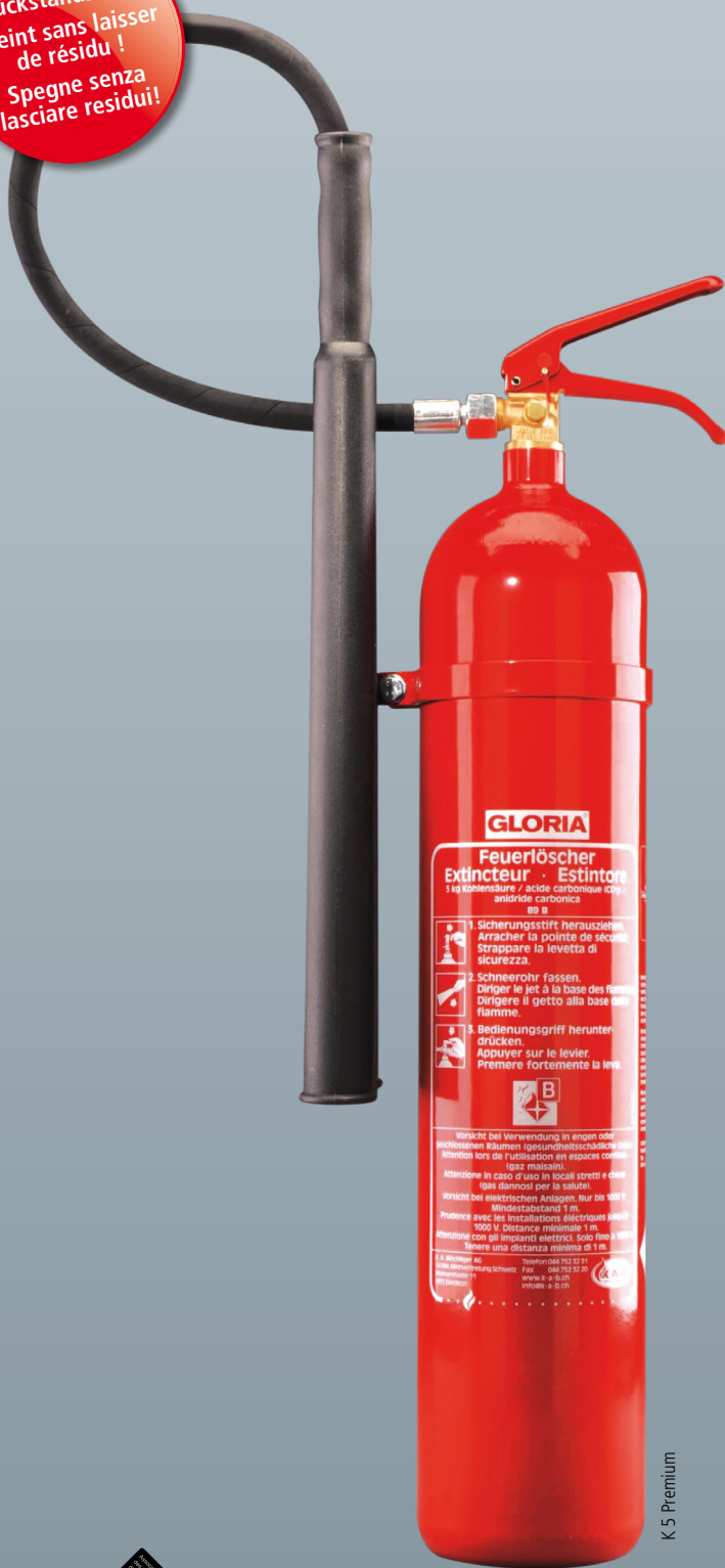
K 5 Premium

Löscht rückstandsfrei! Eteint sans laisser de résidu! Spegne senza lasciare residui!